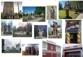
Остановка «Достопримечательности Приюского района»